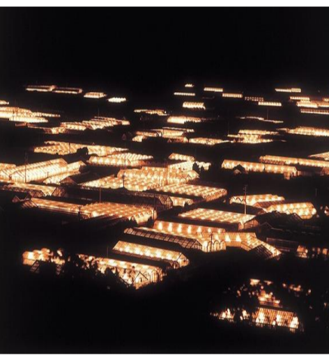
【電照菊に照らされた田原市の夜景】