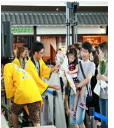
【中部国際空港にて消費宣伝活動】

重陽の節句「青年部による消費宣伝活動」 しであの句句一( た。花とともは9月9日 こ飾る呼ばる旧暦( やだ習はでに向み 輪く慣れは菊けた輪 菊とあお菊消部会 のともっりがた菊消 良もつりか、咲消部 さにた、昔く費宣青 を、は季節伝年部 愛「邪節で活による 内知「陽をある実 外県重の払ること の消菊節長と施 者菊の句一「重陽 へ生」寿か。重陽 P産ををら「重陽 Rが消願「重陽の 全費つ菊の節 国者ての節 1に、節 位認菊